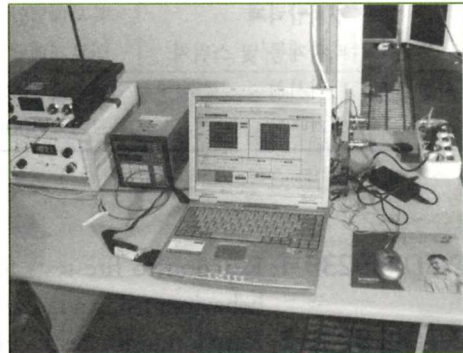
사진2. 시험프로그램 및 계측장치