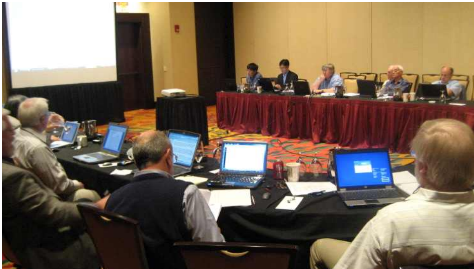
[그림 2] 실무작업반(Working Group) 회의 모습