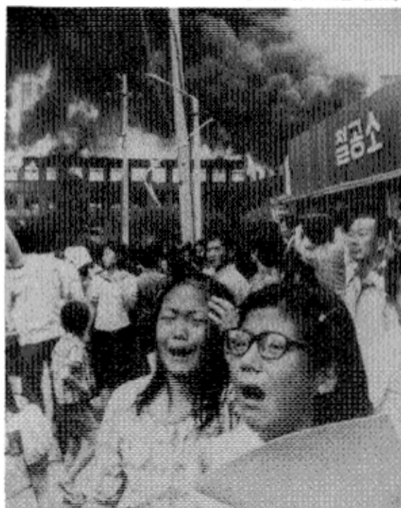
학교는 검은 연기를 뿜으며 타고 있고 어린 학생들이 집에 질러 울고 있다.