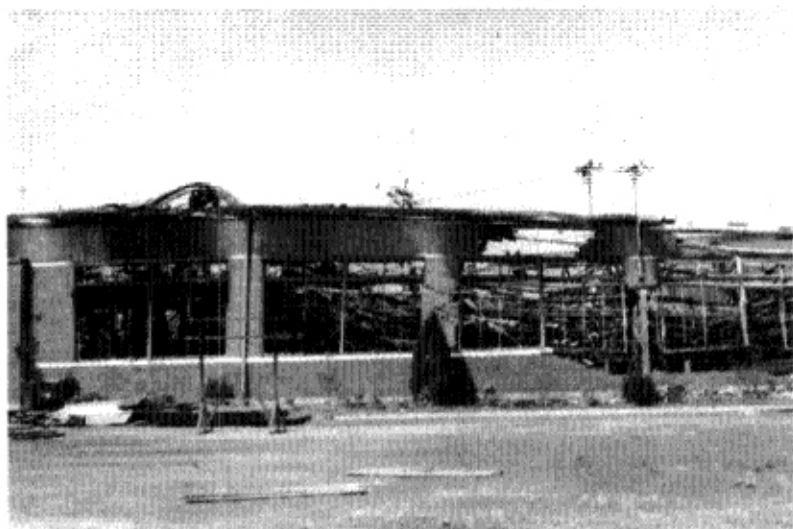
화재후의 공장 외관