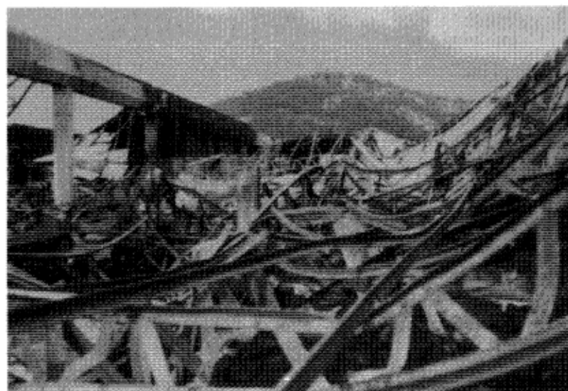
붕괴된 철골 지붕틀과 내부 이재 모습