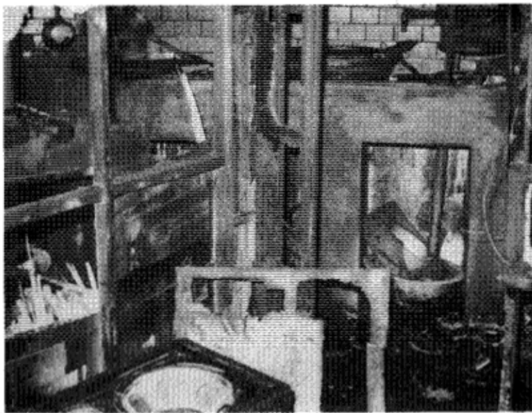
화재발생장소인 2층 주방. 이곳에서 석유콘로에 주유하다 불이났다.