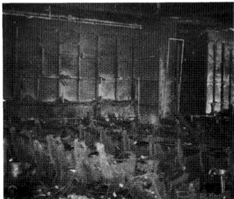
음악감상실의 이재 모습. 의자의 철골부분만 앙상히 남아 있다.