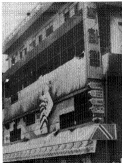
화재후 건물 전면의 모습

—層別 防火區劃 안돼, 上層으로 계속 延燒— 死亡 3名, 負傷 1名, 財産被害 3억원 (動産 不包舍)