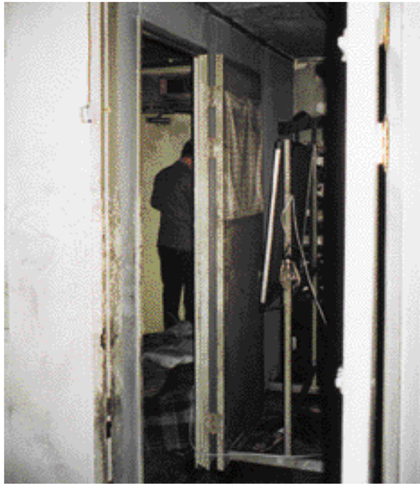
【 2】 2