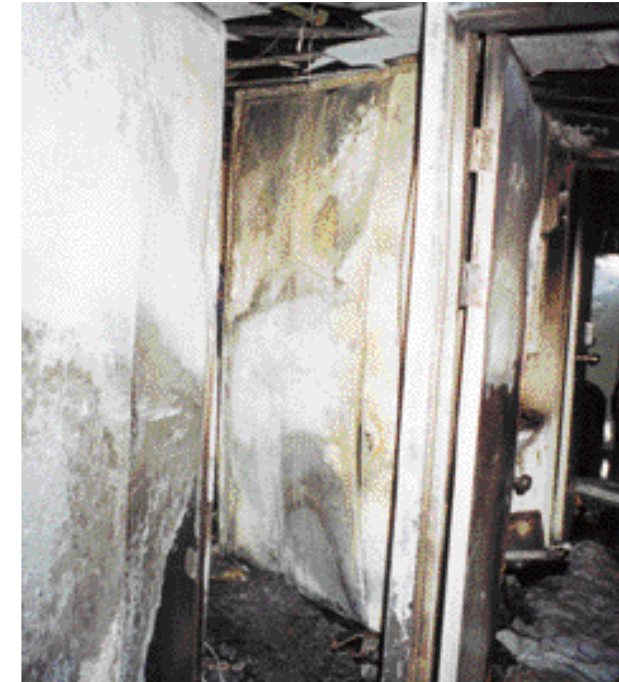
【 1】 1

가 2 , 5 . ( “ 1 ‘ , 가 ” ) 1 가 가 , LPG가 가 1 가 . 5 20 2 , 1 45 40 6 . 1 18 , 2 16 , 3 ~5 17 51 .