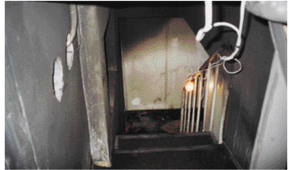
【 3】 1 (4 )