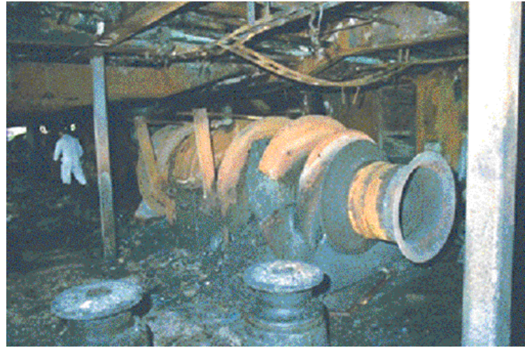
【 9】 (船尾)