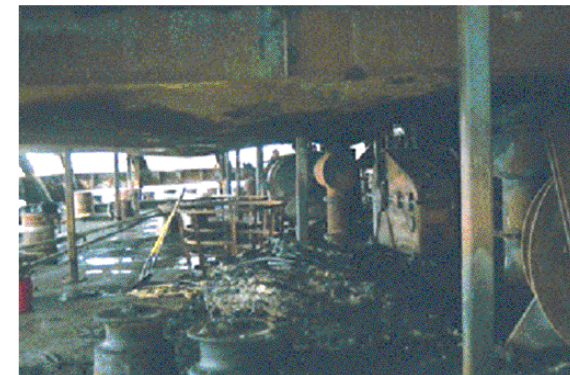
【 8】 (船尾)