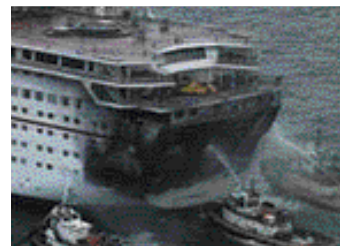
【 5, 6 7】