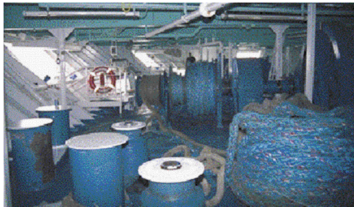
【 1】 1 (船首)

(船首) 4 가 (船尾) 3 가 (船尾) 가 220m 가 8 ( 405kg 7 1 )가 , 3 가 5