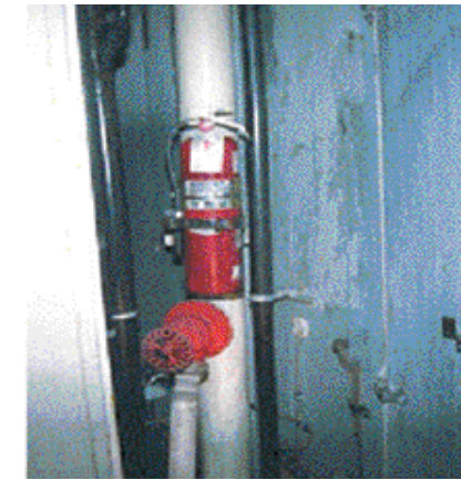
【 2 3】