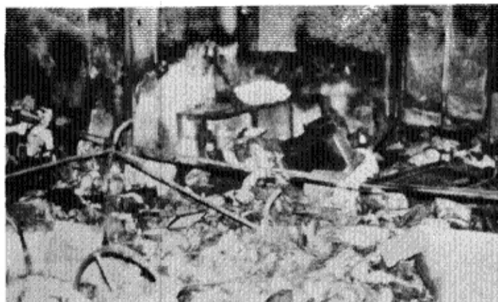
2層 発火場所 早已 罹災狀態