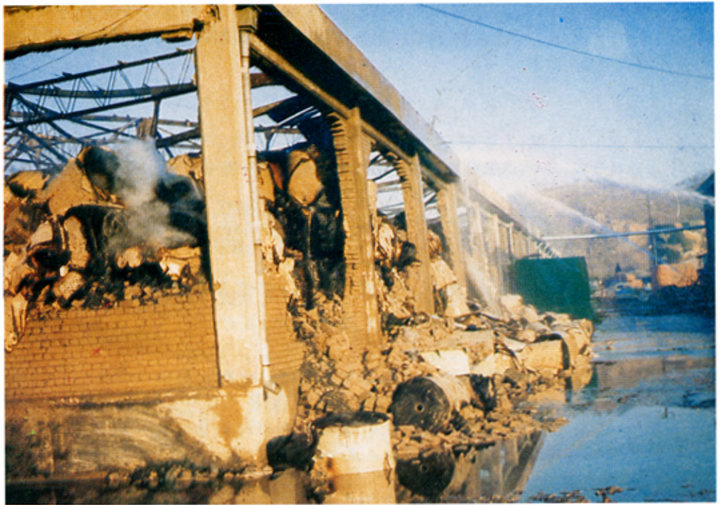
B棟 建物の 収容 動産 罹災狀態