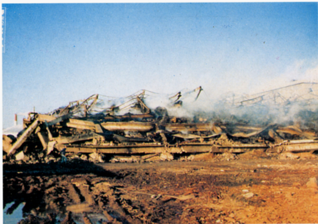
火災後 A棟(N-1倉庫) 罹災狀態