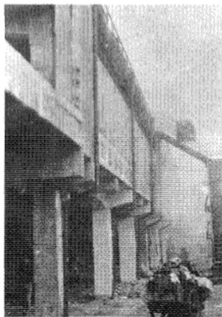
화재 후의 건물 외관