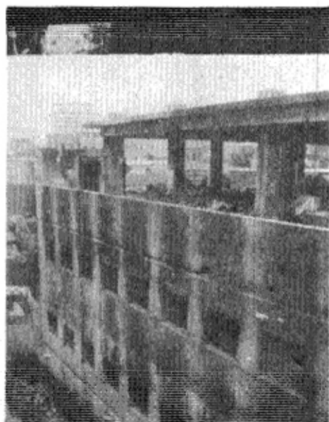
火災建物の 南側外觀