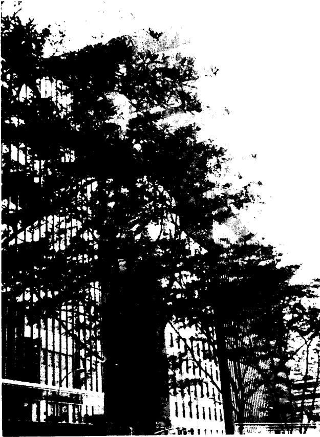
미국의 대표적인 보험 서비스 단체인 Insurance Services Office 본사(뉴욕 소재)