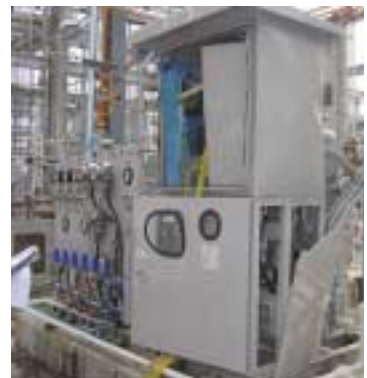
■ 사진 1. 폭발사고가 발생한 전기 패널

나. 사고현황 폴리프로필렌 공정 내 수소 컴프레서용 압력방폭 구조의 패널 앞에서 컴프레서를 가동하던 중 컴프레서 인입 측에 설치된 질소 퍼지 배관을 통해 수소가 전기 패널로 유입되어 전기 스파크로 인해 폭발이 발생하였다. 이 사고로 패널 앞에서 작업하던 작업자 2명이 패널 덮개에 맞아 현장에서 사망하