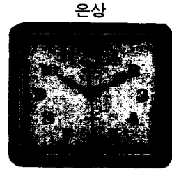
GQ-37 전자프라스틱케이스 벽시계