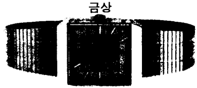
GA-380 아나로그 쿼츠 금장손목시계

30여년간 묵묵히 시계 하나에만 바쳐온 시계인의 걸작품. 오랜 경험과 기술을 바탕으로 정확, 정밀을 생명으로 삼고 제품 하나하나에 깊은 정성을 담았습니다. 야성과 지성, 엘레강스한 멋, 개성과 품격을 더해주는 아나로그쿼츠 남녀손목시계부터 고전미와 현대미를 감비한 벽시계에 이르기까지 시계 전품목에 걸쳐 다양한 디자인으로 소비자 여러분께 보답하고 있습니다. 시간이 만든 눈부신 걸작- 로렌스!