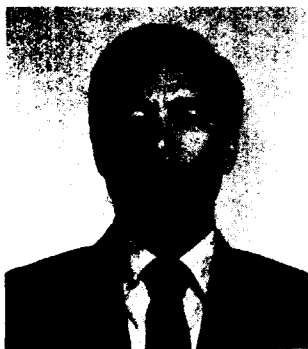
權 大 湜