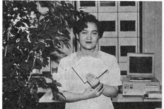
○추천은 감사실 김현화 과장 임희하에 기획조정실 박경희 양이 수고해 주셨습니다.

서울지역에 거주하시는 분은 본 협회 홍보부(전화 780- 8156)로, 지방에 계신 분들은 부산지부(전화 44-9641), 대 구지부(전화 562-3211~5), 대전지부(전화 256-2807), 전주지부(전화 84-2655)로 각각 주민등록증이나 기타 신분 을 확인할 수 있는 증명서를 지참하시고 91년 7월 31일까지 나오셔서 상품을 수령하시기 바랍니다.