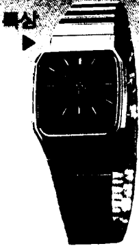
GA - 492G