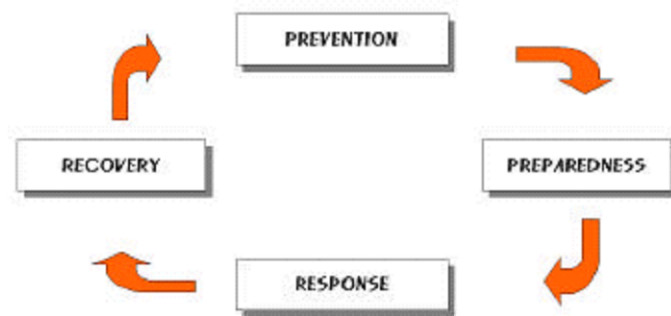
[그림 2] 비상대응시스템 개발 절차

예방단계에서는 시설 내 모든 공정에 잠재해 있는 위험성을 점검하여 사고발생시 예상되는 피해규모를 완화 혹은 제거할 수 있도록 시설물을 설계, 변경, 혹은 보완하는 일련의 과정을 의미한