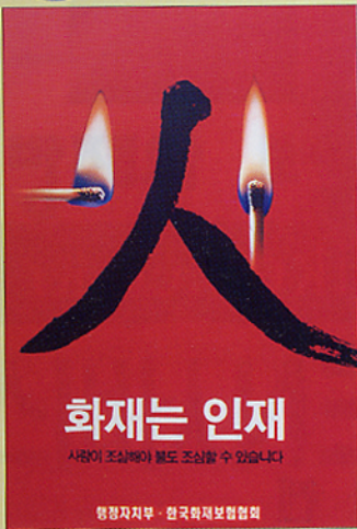
양 현 · 이아진(공동작)